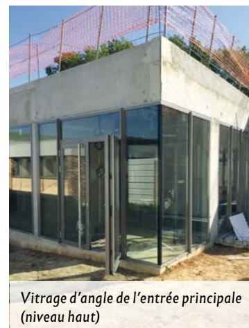
Vitrage d'angle de l'entrée principale (niveau haut)