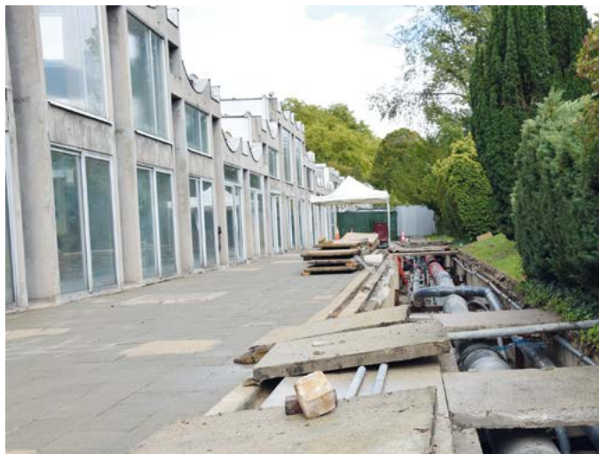
Enlèvement des dalles qui abritent la galerie où passent les canalisations du bassin extérieur

Ces travaux imprévus ont constitué une opportunité ! La fermeture occasionnée a permis d'effectuer la vidange périodique obligatoire imposée par l'Agence Régionale de Santé (2 vidanges par an). Traditionnellement programmée durant les vacances de la Toussaint, elle ne sera pas à refaire et permettra donc une ouverture du bassin extérieur durant toute la durée des prochaines vacances scolaires.