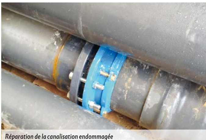
Réparation de la canalisation endommagée