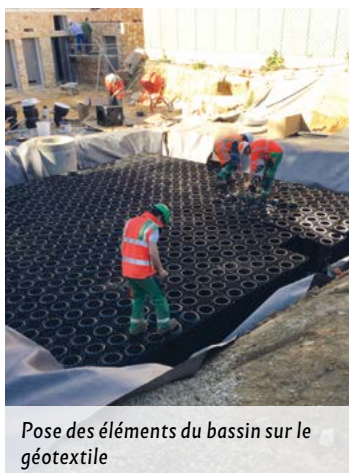
Pose des éléments du bassin sur le géotextile