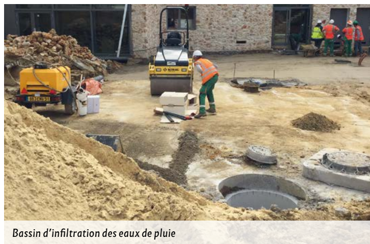
Bassin d'infiltration des eaux de pluie

*syndicat intercommunal qui assure la gestion des réseaux d'assainissement et des aménagements hydrauliques de la Vallée de l'Yvette.